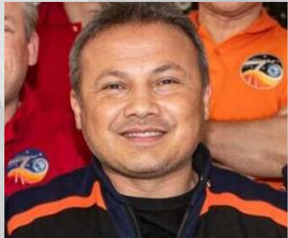
Axiom Mission 3 görevinde Gezeravcı (Ocak 2024)