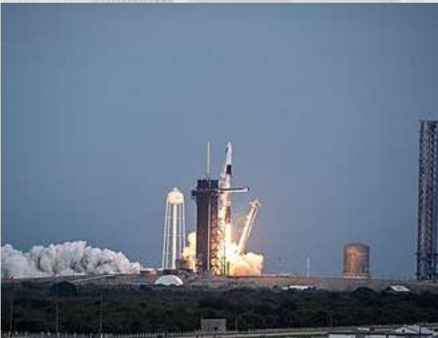
Mürettebatı taşıyan Falcon 9 uzay aracının havalanışı. (18 Ocak 2024, TSi 00.49)

Uzay görevine katılacak ilk Türk astronotlar 29 Nisan 2023 tarihinde Recep Tayyip Erdoğan tarafından TEKNOFEST'te ki "Mayıs ayında başlattığımız süreçte biri asil, biri yedek olmak üzere 2 uzay yolcumuzu belirledik. Uzay yolcumuz bu görevde, ülkemizin kıymetli üniversite ve araştırma kurumlarının hazırladığı 13 farklı deney gerçekleştirecek. Türkiye'nin insanlı ilk uzay görevine çıkacak arkadaşımız uluslararası uzay istasyonunda 14 gün kalacak. Uzay yolcumuzun, uzayla buluşma tarihi 2023'ün son çeyređi olarak belirlendi" açıklamasıyla uzaya gidecek ilk Türk Alper Gezeravcı, ilk yedek Türk astronot Tuva Cihangir Atasever oldu.