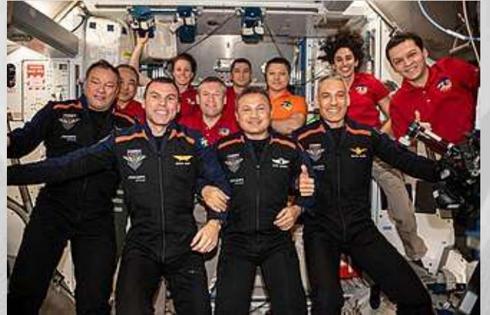
Ax-3 mürettebatları ISS'ten ayrılmadan önce