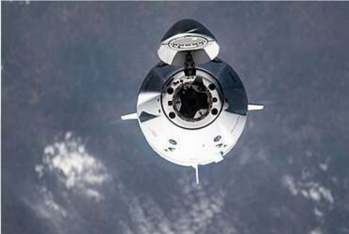
Mürettebatı taşıyan Dragon Freedom isimli uzay aracı Uluslararası Uzay İstasyonu'na yaklaşırken.

Gezeravcı, 2001'de İstanbul Hava Harp Okulu'nda Elektronik Mühendisliği dalında lisans eğitimini tamamladıktan sonra Dayton, Ohio'daki Wright-Patterson Hava Kuvvetleri Üssü'ndeki Hava Kuvvetleri Teknoloji Enstitüsü'nde yüksek lisans yapmıştır.