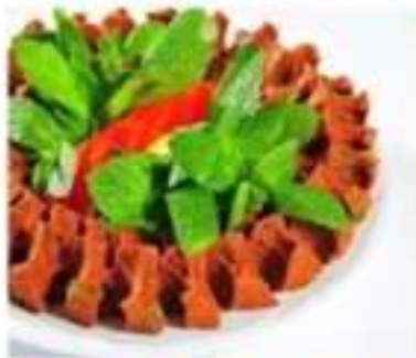
Çiğ Köfte (Etsiz)